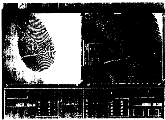
(그림 3) 지문 검색 결과 비교 화면

지방의 단말에서 요청된 검색 Transaction은 Center로 전송되고, Center의 지문비교기에 검색이 수행되며 검색 완료 후 지방으로 다시 결과는 전송하는 방법을 사용하고 있다.